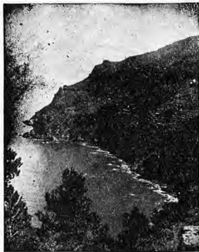
Costa de Banyalbufar

Ara bé, el poble, amén d'uns petits propietaris, estava dividit en dues grans heretats: Planícia i la Ba-