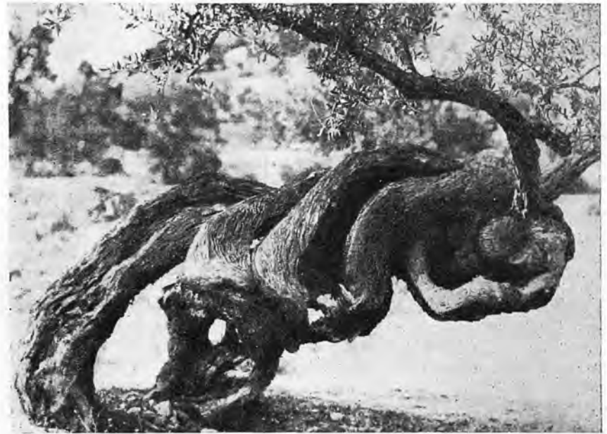
Olivo mallorquín milenario.

de los tiempos pretéritos, sólo el paso de los siglos puede obrar ese prodigio de sus formas increíbles. Ellos han sabido capear todos los temporales resistir las sequías y vicisitudes