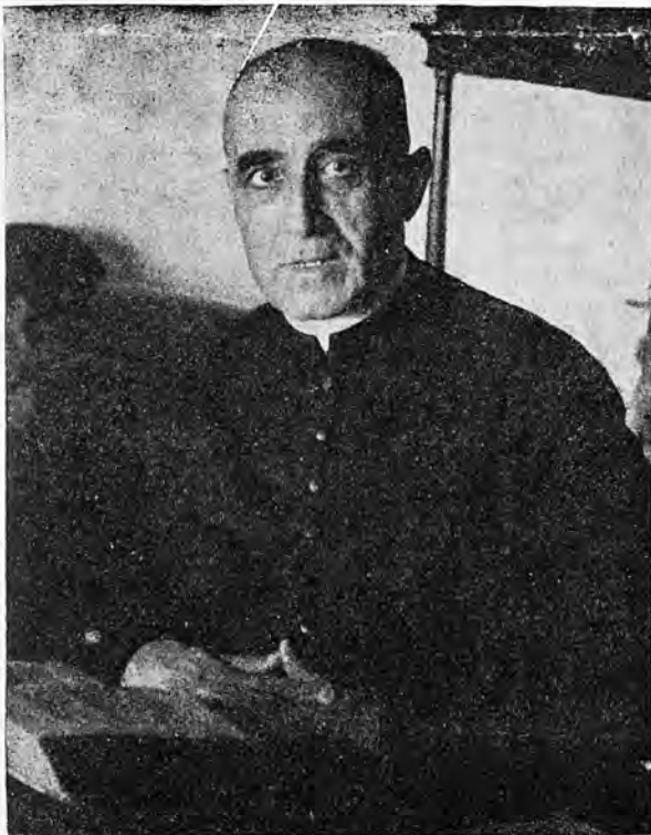
⚡ Mossén Lorenzo Riber