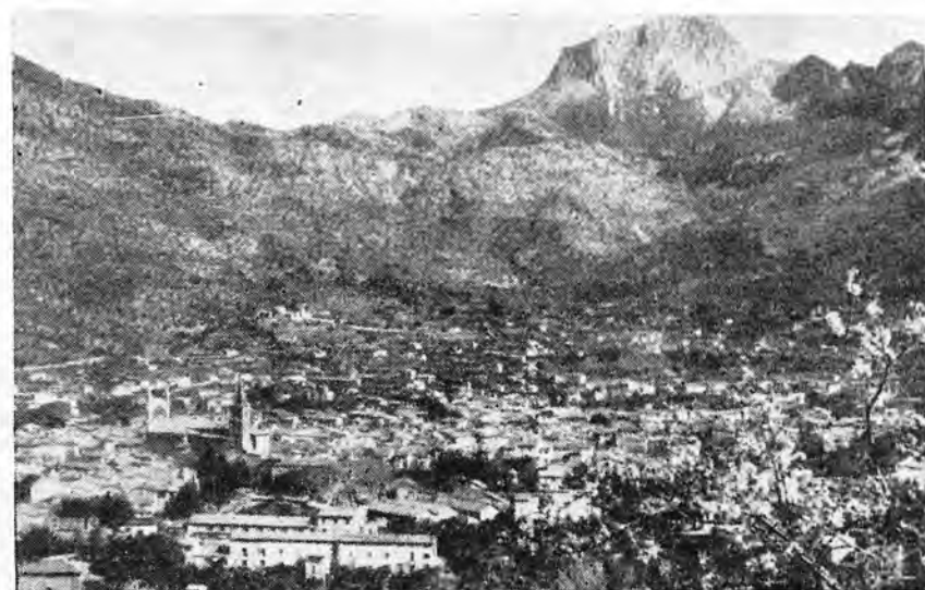
Una bella panorámica de la ciudad e Sóller

De todos modos, por no desviarnos del objetivo de la presente, siempre quedará fija, en los anales de la historia del ferrocarril citado, la pulcra actuación de su personal, siempre gorra en mano atendiendo a los