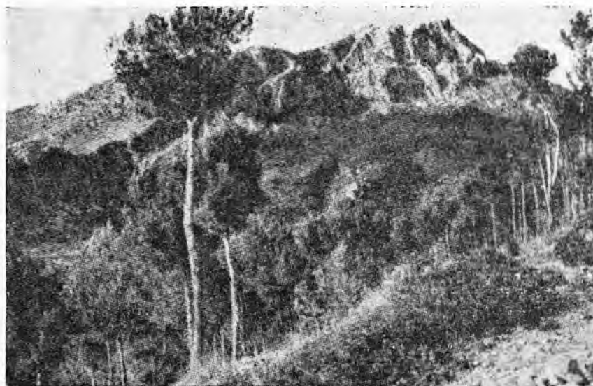
Es Puig de Galatzó. Visto desde Galilea

Ultimamente, la actividad turística que aquí ha sido de una importancia extraordinaria, ha provocado una fuerte inmigración de peninsulares. A Andratx encontramos un ejemplo de falta de integración: la colonia de inmigrantes —llamados aquí "jaeneros"— vive al margen del pueblo indígena y se ha establecido un verdadero "apartheid" entre las dos comunidades, cosa que estorba el normal