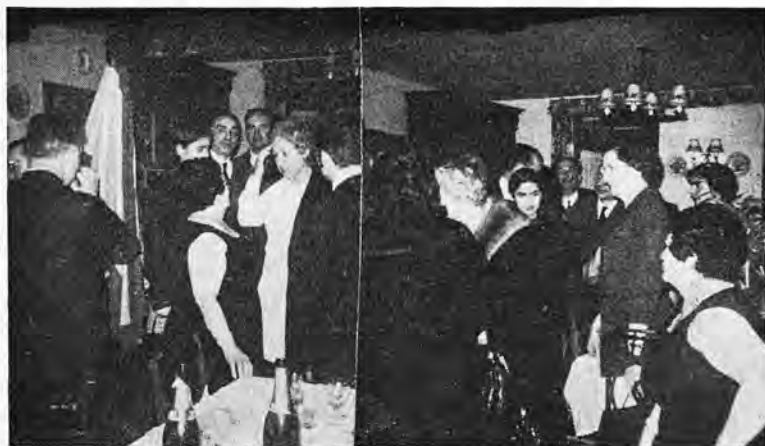
Les invités se disent "Aurevoir!" après quelques heures passées dans la joie et l'amitié.