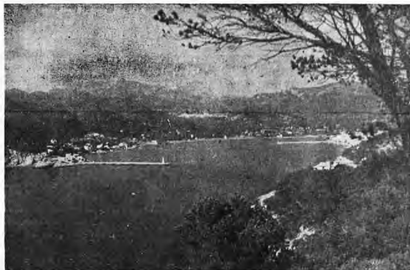
Vista del Puerto de Andraitx

Con tal de llenarse los bolsillos poco importa traicionar la belleza porteña. Primero fue el Prat; ahora el emplazamiento del Club Náutico. ¿Pero señores, es que no pueden dejar de jugar con el Puerto? Todos