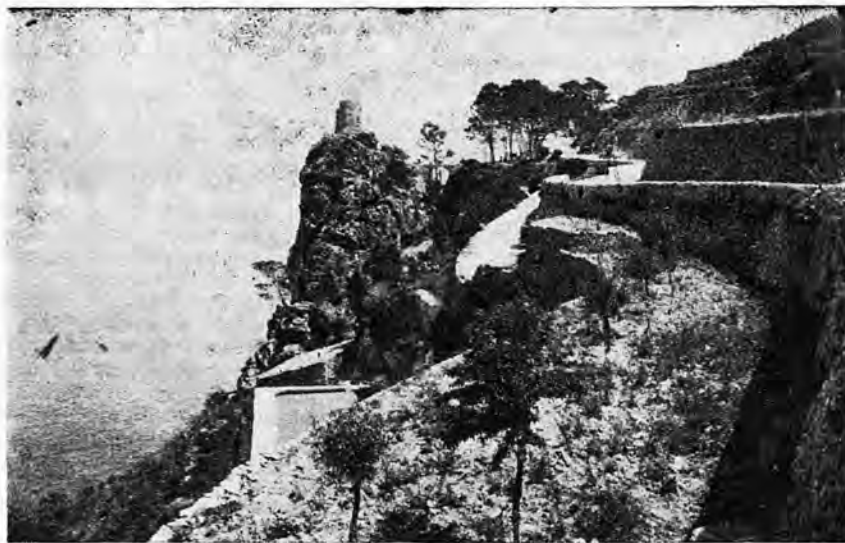
"Torre de las Animas", en el camino de Bañalbuñar a Estallencs.

La querencia al terruño donde se nació —como la ascendencia familiar— no es preciso justificarla por unos méritos determinados. Basta con la lógica femenina de un "por que sí". Pero si además de esta mo-