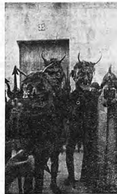
Aunque parezca mentira, "els dimonis" también se dejaron fotografiar".

No podemos silenciar al hablar de las fiestas de San Antonio el tipismo local de la coca con verdura y espinacadas con anguilas, pastas puramente poblenses a las que son invitados todos los amigos, pues son muy escasas las familias de La Puebla que en la noche de la víspera de San Antonio no tenga sentados a su mesa a numerosos amigos forasteros.