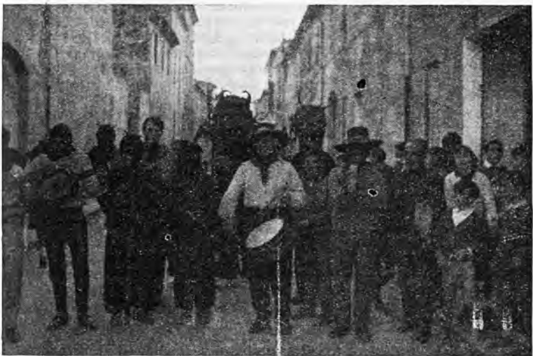
"Els Dimonis" en sus pasacellas, son la admiración del vecindario

V. a Diada Escolar de la no-violencia i la pau. 30 gener 1968