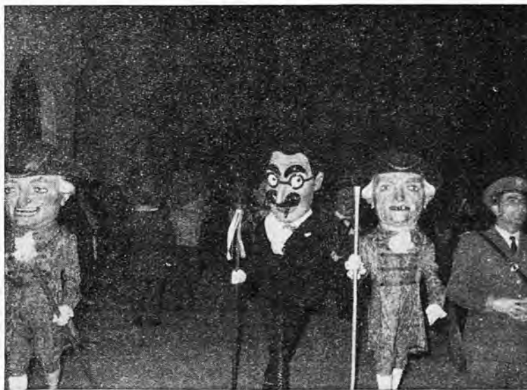
Los "Cabezudos" son la nota simpática en las calles de la población; unos "cabezudos muy bien vestidos y muy a lo señor."

Desde este momento y hasta altas horas de la noche y primeras de la madrugada, el bullicio y el entusiasmo en las calles poblenses son incontenibles y en cada uno de los "foguerons" puede encontrarse la canción típica acompañada del rugir de la zambomba, que a pesar de su monótona melodía, alegre y animada, hasta conseguir hacer cantar hasta a los más profanos.