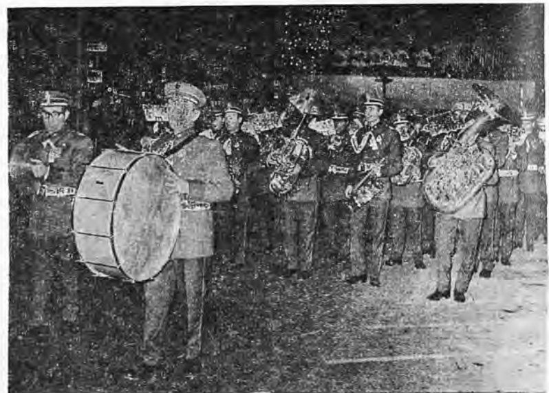
La Banda Municipal de Palma, recientemente formada, y de la que damos noticias en nuestra «Crónicas de Baleares», desfila por las calles de nuestra ciudad con motivo del aniversario de la Conquista de Mallorca por el Rey Jaime I.