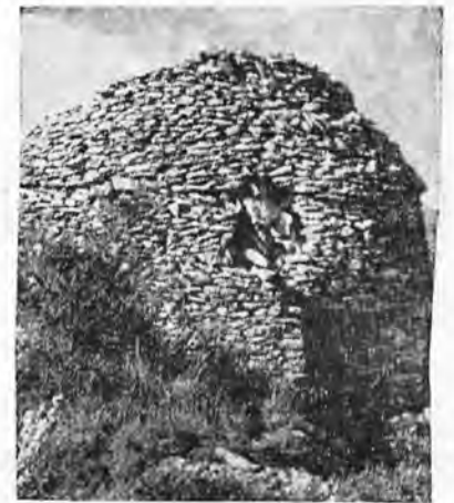
Un cabanon dans un coin

raile fortifiée contre l'envahisseur, ont résisté aux siècles et aux intempéries. C'est dire le soin avec lequel ils ont été réalisés: de nombreux spécimens et vestiges sont parvenus jusqu'à nos temps modernes. C'est pourquoi nous formons le voeu que ces cabanons pointus, qui subsistent encore de nos jours, —et que nous serions bien embarrassés de construire!...— soient préservés de la destruction (ce serait une aberration!...) et conservés jalousement comme les fiers témoins d'un passé qui ne fut pas sans grandeur. Certains constructeurs de nos villas modernes ont conservé avec respect et intérêt le cabanon enclos dans leur propriété; c'est heureux et nous les en félicitons... Mais, il faut le dire, pour la valeur de notre propos, ils