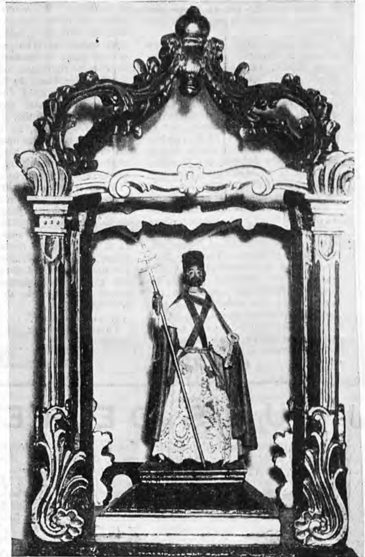
Imagen de San Pedro que guarda y venera con gran devoción el pósito de pescadores de Andraitx y que lleva la siguiente inscripción: "Lo o fer el mestre seus Mesr Jauan, Figeira Valls "Gixe" per el Gremi de Pescados de Andraig l'any 1413".