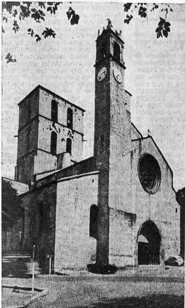
La Cathédrale de Forcalquier