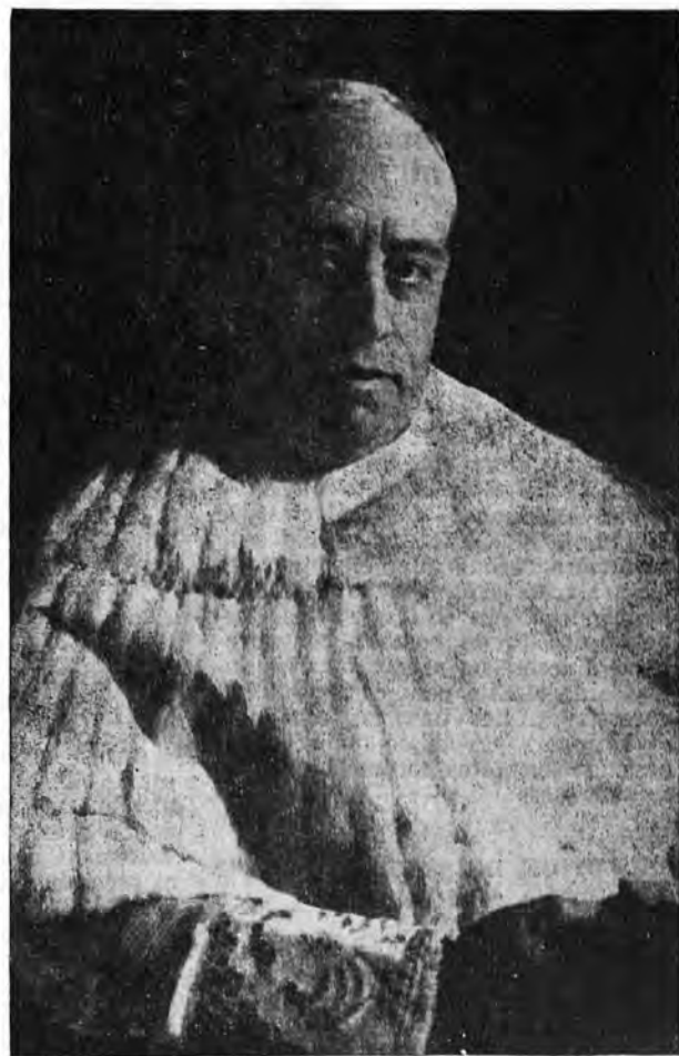
Mossén Costa i Llobera

Abandoná el seu forat la clàssica abella. I, convertida amb estrella, lliure volá cap a l'eternitat