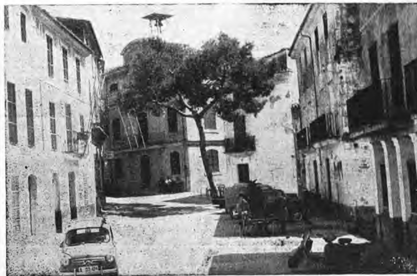
La histórica plaza de San Pedro, escenario de los más significativos episodios de Andraitx y su comarca. (Foto R. Ferrer, Andraitx).