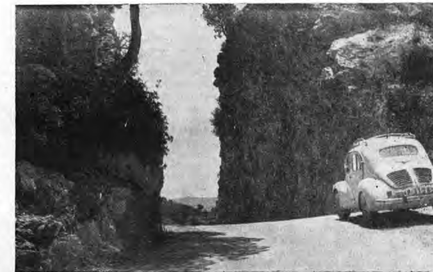
El Coll de N'Esteva en la pintoresca ruta Andraitx-Capdellá.

—No estaba aquí cuando se construyó este camino, en sus dos últimas etapas, que lo han hecho accesible a los coches. Recuerdo, en cambio, la etapa anterior, cuando se abrió esta vía entre las peñas. Yo estaba presente en el acto inaugural, una ceremonia pintoresca y, al mismo tiempo, emotiva, que siempre