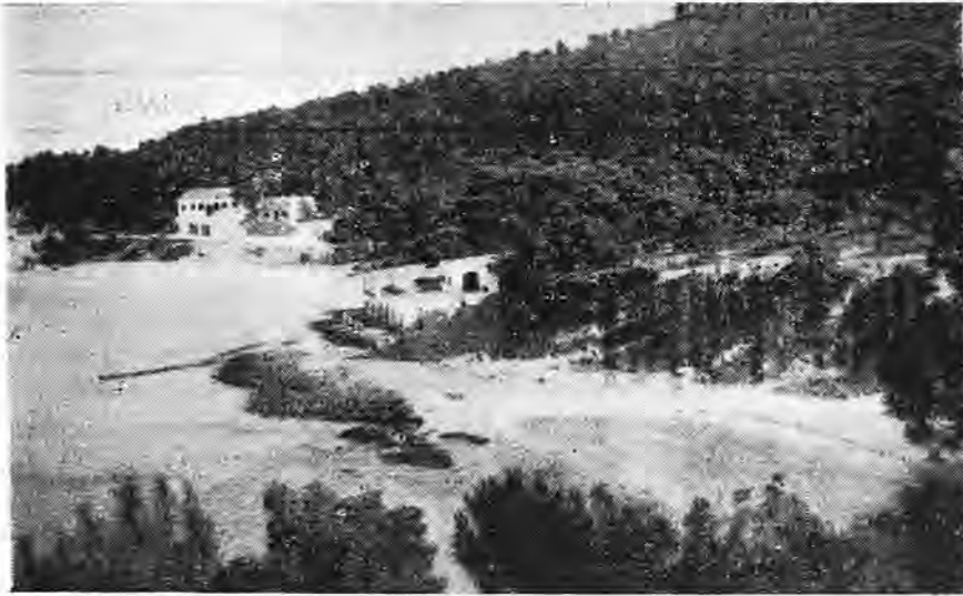
San Telmo.

sur le toit de laquelle se trouve encore un canon à boulets, vestiges des temps passés où les arabes revenaient non plus en conquérants, mais tout simplement pour piller aux chrétiens leurs moutons, poules, chèvres, poissons séchés, etc.... Une fois, même,