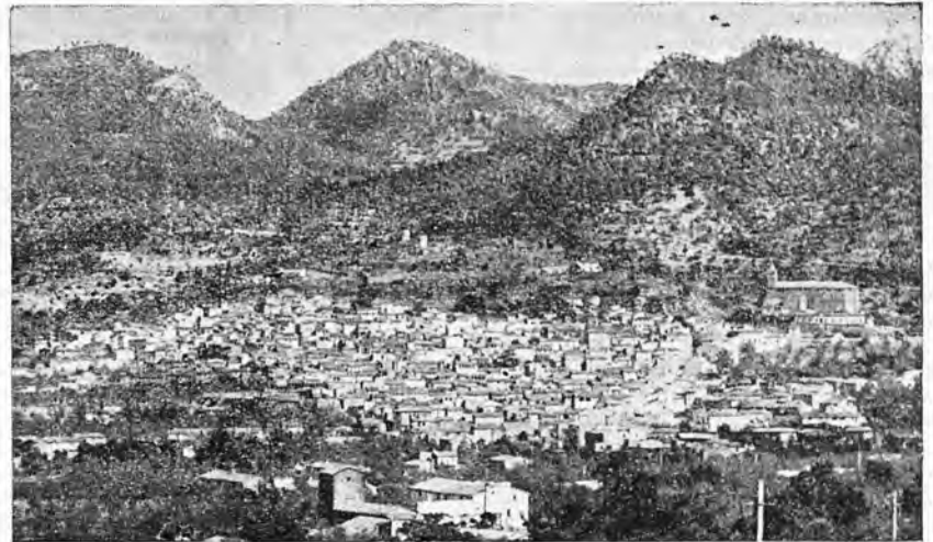
Vista general de Andraitx