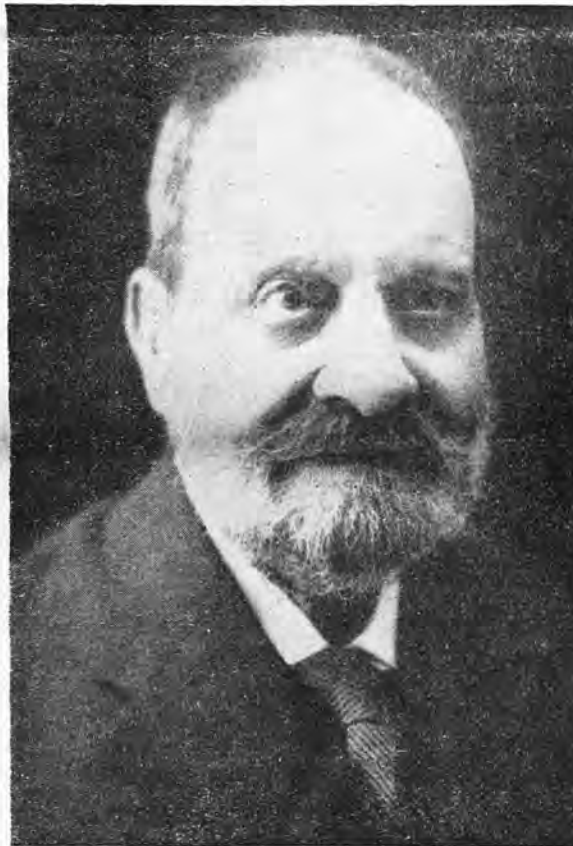
DON PEDRO FERRER

En el 30 de Junio de 1930, en ocasión de sus bodas de oro con la Medicina, sus paisanos le dedicaron un grandioso homenaje. Entre ellos citaremos el Colegio Médico de Palma, el Ayuntamiento de Andraitx, el Ateneo Palmesano y todas las entidades corporativas de la isla, como centenares de personas de todas las clases sociales. En la misma fecha, y en ocasión del homenaje, se publicaron dos libros de Pedro Ferrer el "Sagrario de la Salud" y el "Idealismo". Estos dos libros son una recopilación simplificada de lo mucho publicado por Ferrer. Están escritos con un estilo agradable y ameno, es un verdadero regalo lo que ofrecen sus interesantes páginas al lector por su fácil comprensión, por sus buenos conceptos de higiene, como de la sa-