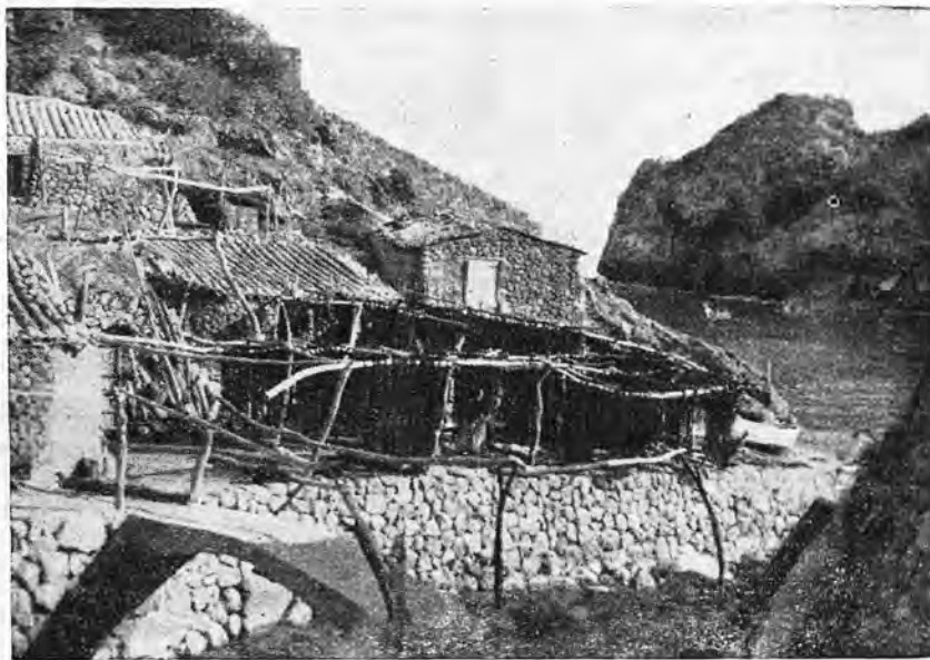
La Cala de Deyá