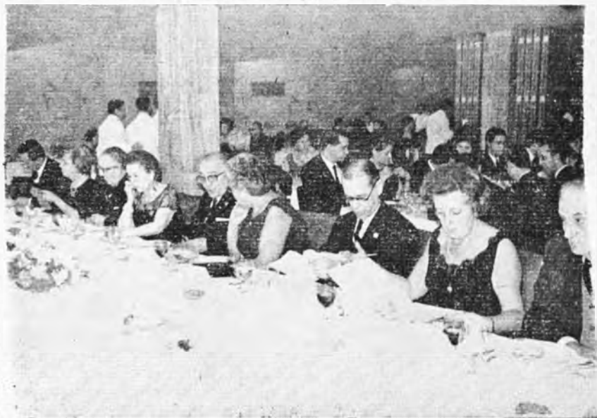
Un aspecto de la presidencia en la cena de adjudicación de los Premios.