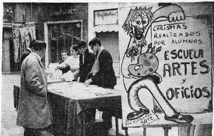
Operación Christmas. Diciembre 1964