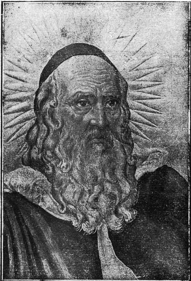
La effigie del Doctor Iluminado según una sugestiva y bien lograda pintura al óleo

beauté de Palma — d'après les chroniques "très noble et très vertueuse" — allant même jusqu'à la pourchasse à cheval dans l'église Santa Eulalia où elle s'était réfugiée. Lassée de ces "attentions" un peu brutales, la "noble et vertueuse" dame en question accorda une entrevue à Llull qui se rendit au domicile de la belle, bouillant de passion. Il était à peine entré que celle-ci, ouvrant ses vêtements, lui dévoila une poitrine entièrement rongée par un affreux cancer. Telle fut, d'après une très ancienne tradition, l'origine de la conversion de Llull. Il faut pourtant noter que cette forme de conversion violente se retrouve dans la biographie de tant de saints personnages de l'époque que l'on pourrait douter de son authenticité. Llull lui-même a d'ailleurs donné, des raisons qui l'incitèrent à changer de vie, une version tout à fait différente. D'après lui, sa conversion serait due à cinq apparitions du Christ crucifié, cinq nuits de suite, alors qu'il était en train de composer des