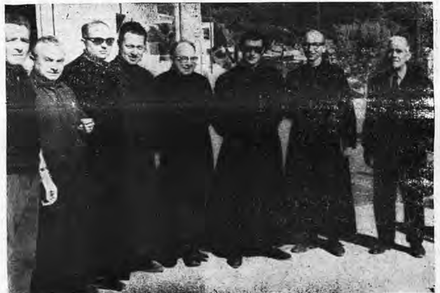
ACTUALIDAD ARRACONENSE: SAN FELMO Y LOS CADETS DE MAJORQUE

Hay muchos puntos de contacto entre el capitalista y el hombre de sensibilidad. Un capitalista coloca unas pesetejas aquí, unos billetitos allí, y así llega a tener repartido su capital. Y no es de admirar que el hombre haga un gesto de dolor de amputación cuando se le va a rodar uno de esos cobijos. Lo mismo hace-