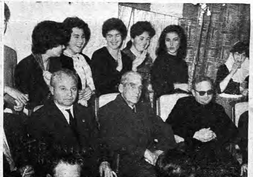
PRESIDENCIA DEL ACTO.