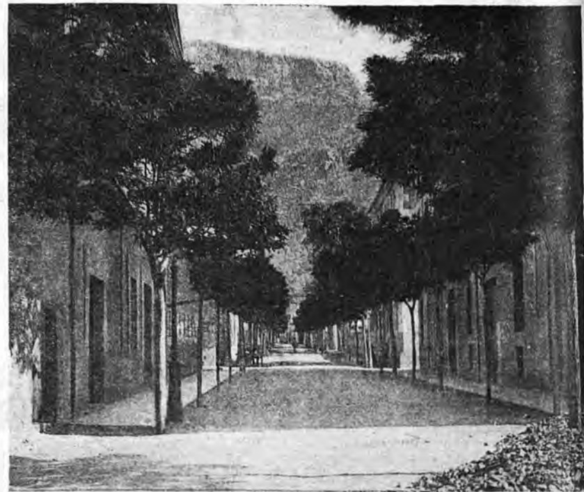
SOLLER. — Calle Santa Teresa.