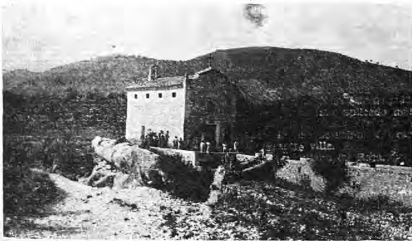
ORATORIO DEL «COCO». — Lloseta y los grandes peñascos en donde fué hallada la Imagen de Nuestra Señora de Lloseta.

CADA año, transcurridos dos días después de Pascua de Resurrección, a poca distancia de la villa de Lloseta y en el lugar denominado «es cocó», los moradores de esta villa junto con un importante número de gente de toda la comarca, se reúnen, con el mismo júbilo y entusiasmo con que días antes entonaban los alegres alledos Pascuales, para celebrar la conocida y renombrada Romería del Cocó.