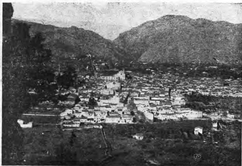
POLLENSA. — Vista general.

P OLLENSA, se halla situada en la parte N.E. de la paradisíaca isla mediterránea de Mallorca. Situada al norte con el mar, La Puebla y Campanet son sus límites al sur, Alcudia y el mar la limitan por el este mientras que Escorca y el propio mar la rodean por la parte occidental.