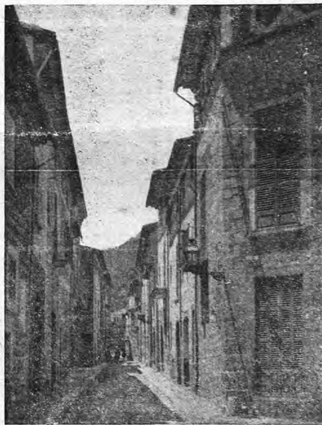
SOLLER. — Calle Isabel II. (Pasa en página 2)

Allá a las nueve de la noche los niños cabeceaban, junto al fuego del llar. Para reanimarles había que dar-