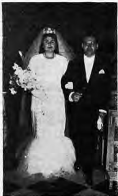
■ El día 22 de junio, a las 11 de la mañana, tuvo lugar en la iglesia