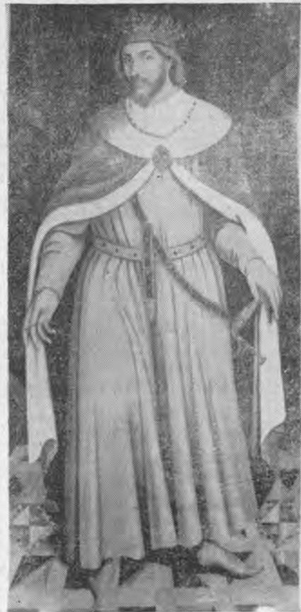
REY JAYME I o EL CONQUISTADOR (Según el cuadro existente en el Ayuntamiento de Palma.)