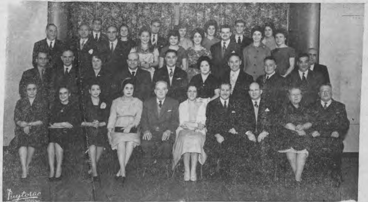
BANQUET DE BORDEAUX

« Après Paris, Rouen, Reims, Montluçon, Bourges, voici Bordeaux, Bordeaux qui organise aussi son banquet des Cadets de Majorque. Bravo à nos amis bordelais qui ont pris l'initiative de cette manifestation fraternelle et merci à vous tous, mes chers compatriotes qui avez eu à cœur de répondre à leur appel.