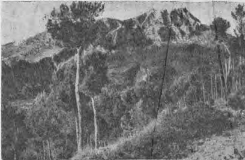
ES PUIG DE GALATZO, (1.040 m.) Visto desde Galilea.

Siempre existe gente animosa — generalmente joven — que en los días calurosos de verano se halla dispuesta a romper la monotonía de su más o menos forzada permanencia veraniega en un pueblo de montaña.