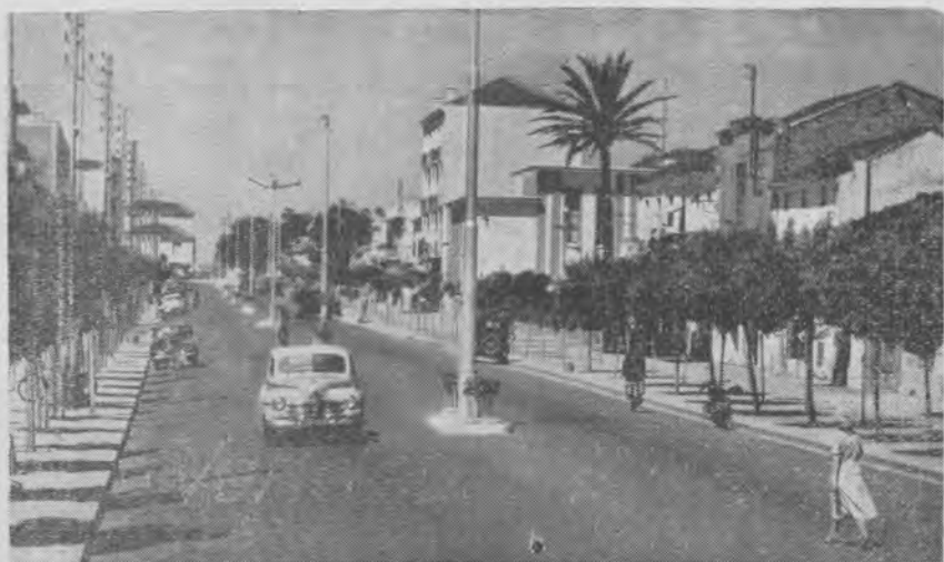
FORT-DE-L'EAU. — Grande Rue de France.

Pons Jacques, jardinier, 3 : 4.000 à 5.000 francs.