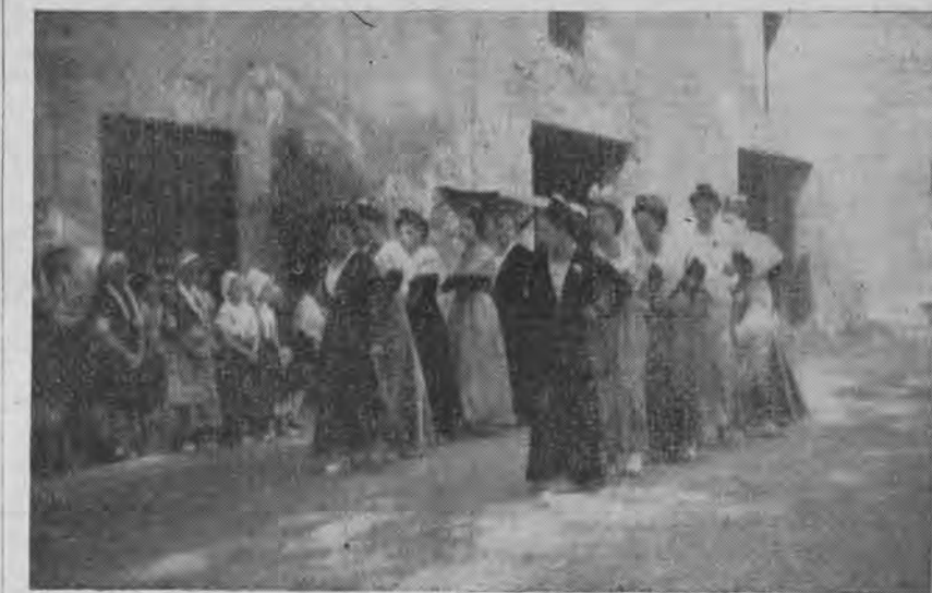
Un groupe d'Arlésiennes