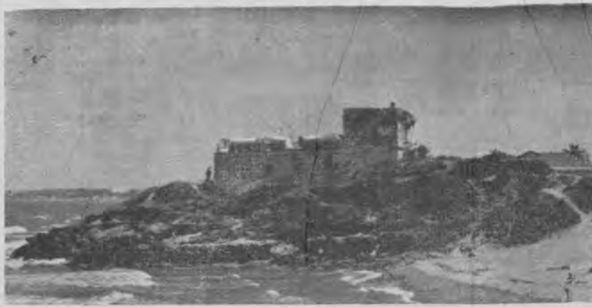
FORT-DE-L'EAU. — Voici le Fort où les familles venaient passer les nuits après la journée de travail.

SITUÉE au fond de l'ample baie d'Alger, à dix-neuf kilomètres de la ville, est une petite cité charmante de quatorze mille habitants dont la plage est renommée. Elle tient son nom du fort construit jadis par les Turcs et dont il ne reste aujourd'hui que les ruines, El Borj et Kifan , qui signifie Fort de l'Eau. En effet à l'intérieur de la forteresse jaillit de la roche un ruisseau d'eau vive.