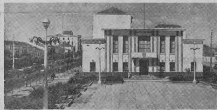
FORT-DE-L'EAU. — L'Hotel-de-Ville.