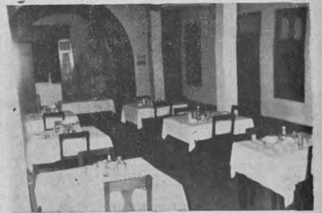
Parte del Comedor