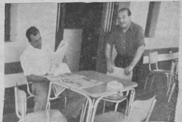
Entrada del Bar