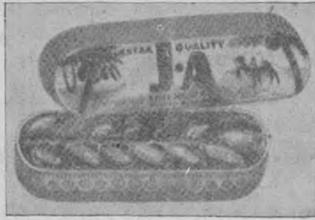
Boîtes Marseillaises de Luxe