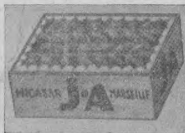
Caissons 1-3-5-10-20 kgs