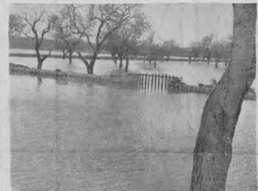
La carretera de Lombars, cerca de la Estacion del ferrocarril de Santanyi, completamente inundada, a causa del «diluvio» del 4 de octubre. Al fondo diversas fincas, igualmente inundadas, lo que da fe, de la gran cantidad de agua caída sobre Santanyi.