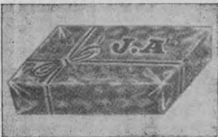
Emballages: Cellophane 250 et 400 grs