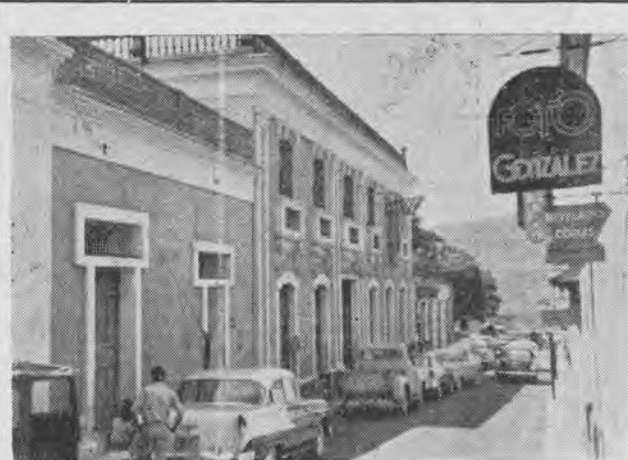
HOTEL SELECT Telef. 2201 SAN CRISTOBAL — Venezuela Calle 9, nº 39 Telg. y Cable «HotelSelect» Atendido por su propietario : Pedro ALEMANY

VENDEURS !!! DATTES SPÉCIALISTES !!! choisissez la... J. A. pour être bien servis