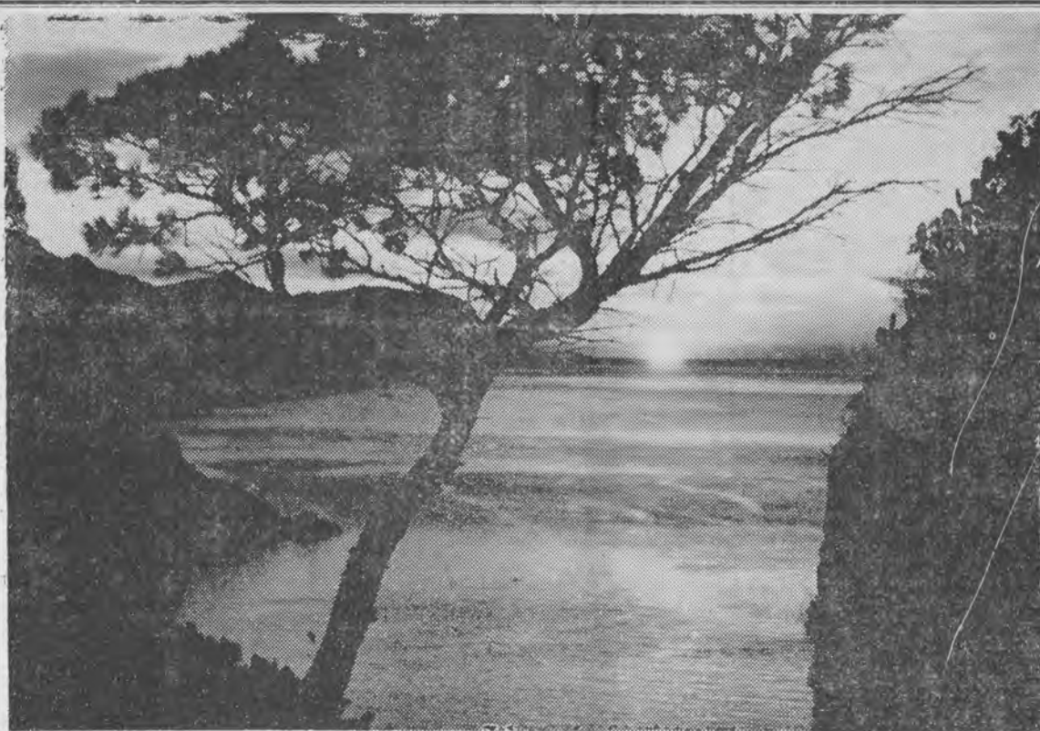
COUCHER DE SOLEIL SUR LA COTE D'ESTALLENCHS