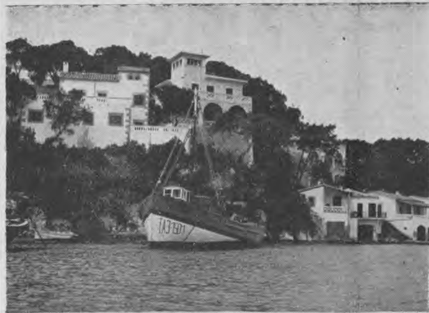
CALA FIGUERA (Santanyi), donde se dan cita cada verano, turistas de los más distintos puntos del globo.