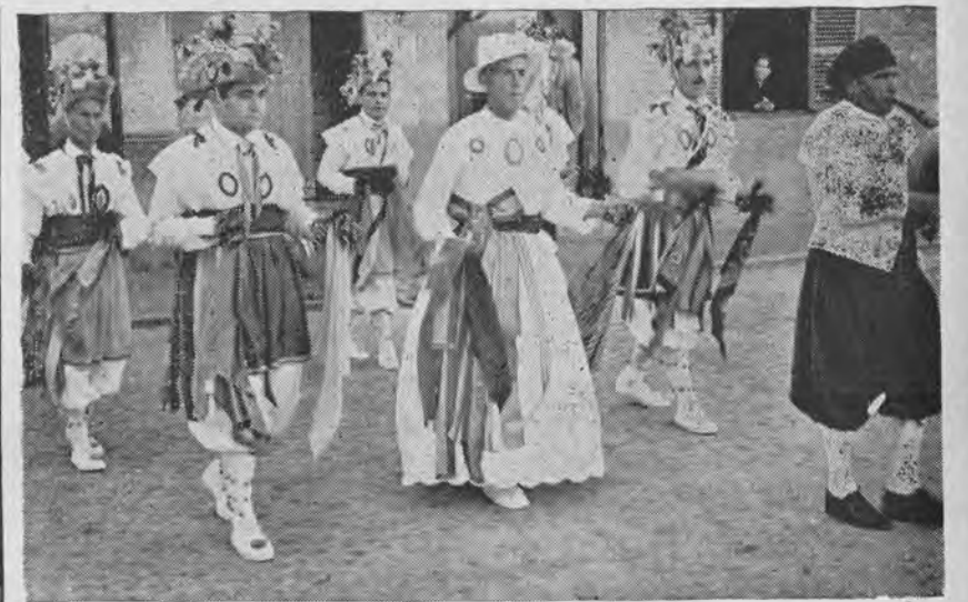
«COSSIERS» de Algaida, las danzas más antiguas de Mallorca.