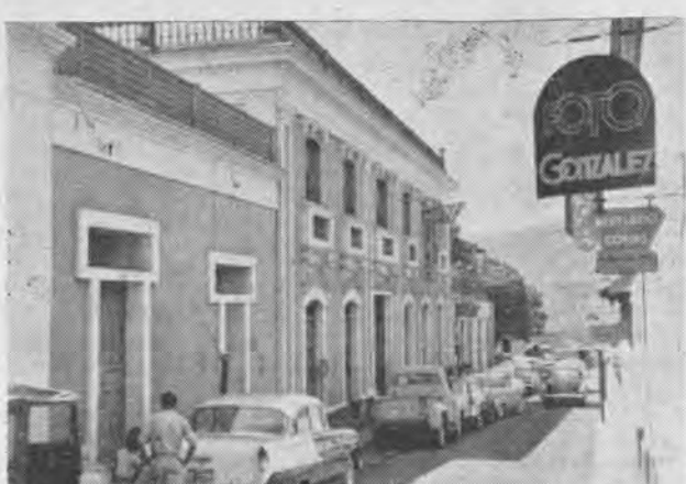
HOTEL SELECT Telef. 2201 SAN CRISTOBAL — Venezuela Calle 9, n° 39 Telg. y Cable « HotelSelect » Atendido por su propietario : Pedro ALEMANY