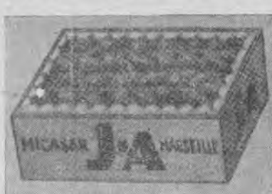
Caissons 1-3-5-10-20 kgs

DATTES Vendeurs!! Spécialistes!! choisissez-les... Toujours imité jamais égalé, MICASAR dynamique, jeune et moderne, livre les meilleures dattes aux meilleurs prix