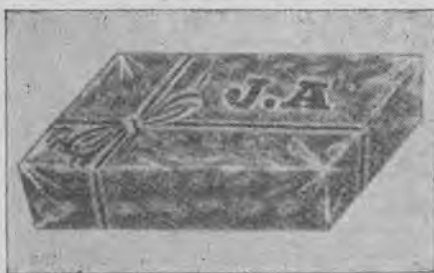
Emballages: Cellophane 250 et 400 grs