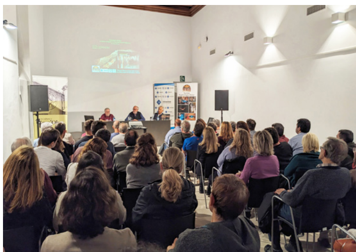
Presentació del llibre a Palma a les instal·lacions de Ca n'Oleo (Universitat de les Illes Balears) el 28 de novembre de 2023. Presentation of the book in Palma at Ca n'Oleo facilities (Universitat de les Illes Balears) on November 28, 2023.

amb un resum de les dades essencials sobre la cavitat, així com una exhaustiva bibliografia sobre la mateixa. El llibre està imprès en color amb gran qualitat, amb cobertes dures i format A4 apaïsat. L'obra està redactada en català.