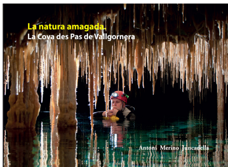
Aspecte de la portada del llibre. Layout of the book cover.