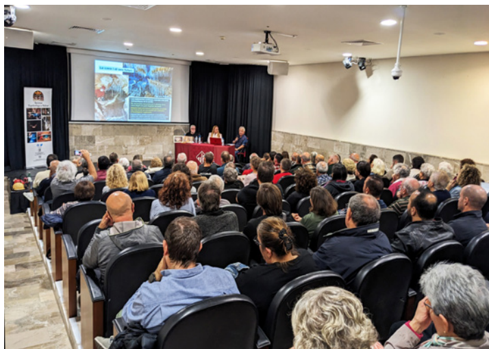
Presentació del llibre a Lluçmajor al Claustre de Sant Bonaventura (Ajuntament de Lluçmajor) el 21 de novembre de 2023. Presentation of the book in Lluçmajor at the Cloister of Sant Bonaventura (Ajuntament de Lluçmajor) on November 21, 2023.