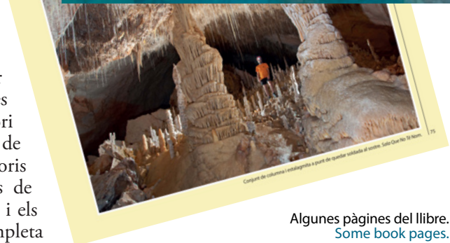
Algunes pàgines del llibre. Some book pages.