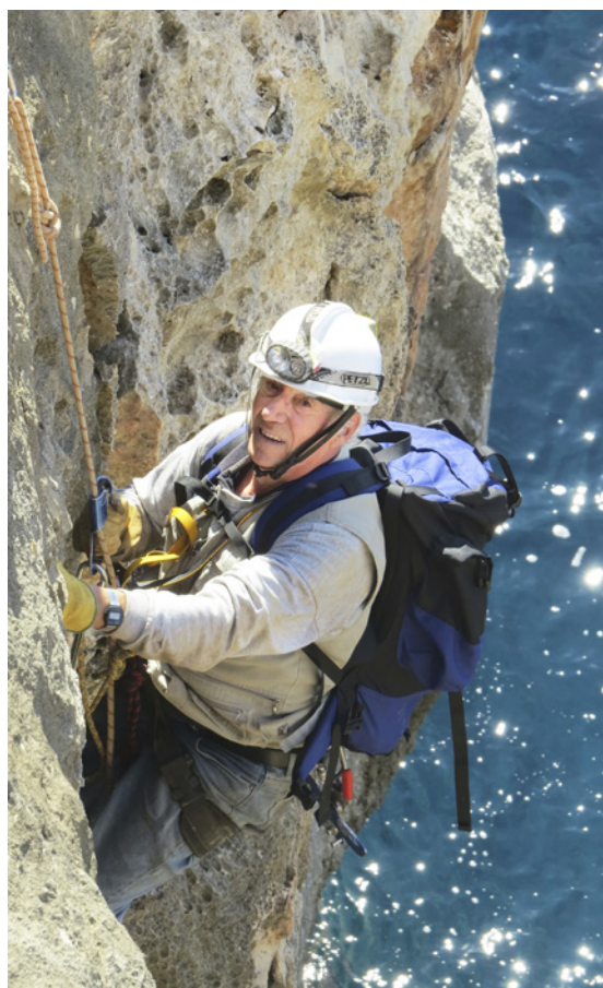
Accedint a la cova de ses Estaques (Maó) mitjançant tècniques d'espeleologia vertical, l'any 2015.