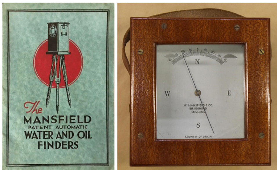
Figura 6: Manual d'instruccions i vista zenital d'un "descubridor de Mansfield". A través del visor s'hi observa l'agulla magnètica.

"La acción principal del aparato, que indica la presencia del agua hasta 1.000 pies de profundidad, registra la fuerza de las corrientes eléctricas que circulan siempre entre la tierra y la atmósfera, y cuya intensidad aumenta en la proximidad de las corrientes de agua subterráneas. Si debajo del sitio en que se coloca el aparato hay algún manantial subterráneo, la aguja del cuadrante comienza á moverse; tomando nota exacta de grados marcados en la escala y cambiando varias veces la posición del aparato, el sitio en donde se hayan registrado los movimientos acentuados de la aguja será el indicado para emprender las operaciones de perforación. Si la aguja permanece inmóvil será prueba de que no existe ningún manantial en el lugar en donde se haya situado el aparato" (Anònim, 1909a).