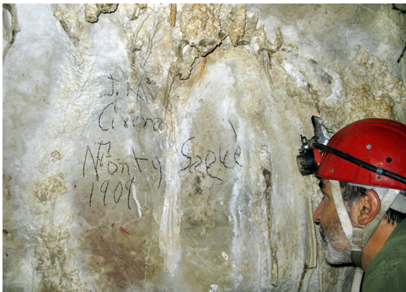
Figura 4: Els grafits de Cirera i Font i Sagué, en l'interior de la Cova Nova de Son Lluís (Porreres, Mallorca). Figure 4: The graffiti left by Cirera and Font i Sagué inside the Cova Nova de Son Lluís (Porreres, Mallorca).

En l'epistolari que de Font i Sagué conserva l'arxiu del MGSB s'han localitzat set cartes autògrafes de Josep Maria Cirera, datades entre 1907 i 1909, en les quals sol·licita al mossèn que li estudiï les possibilitats de trobar aigua en una finca de la seva propietat; de passada el convida a veure les coves existents a la mateixa finca i intenta acordar una data per trobar-se al moll de Palma o bé a Son Lluís; finalment reconeix que Font va fer el viatge. No hi ha dubte, doncs, que els dos grafits es varen fer el mateix dia, durant la visita