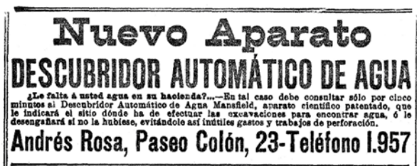
Figura 8: Anunci publicat per Andrés Rosa ( La Vanguardia , 18/05/1913).

Figure 8: Press advertisement published by Andrés Rosa ( La Vanguardia , 18/05/1913).