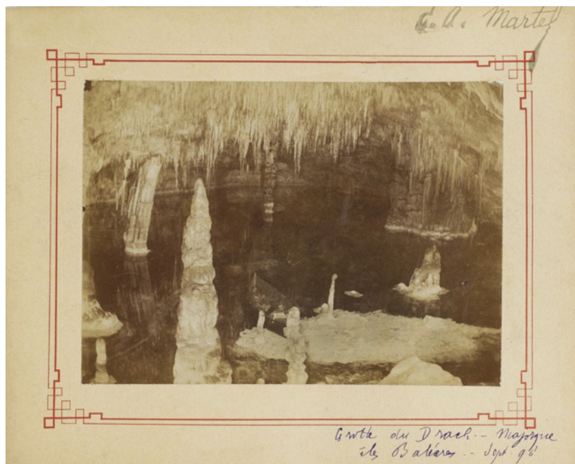
Figura 1: Fotografia original de les Coves del Drac ( Ilac Miramar ) presa per É.A. Martel el setembre de 1896 (Font: gallica.bnf.fr / Bibliothèque nationale de France). Figure 1: Original photograph of Coves del Drac ( Ilac Miramar ) taken by É.A. Martel in September 1896 (Source: gallica.bnf.fr / Bibliothèque nationale de France).

science des cavernes " (MARTEL, 1900) no es basa en el coneixement directe de les mateixes, sinó en informacions que rebé de qualque col·laborador i incorporà a alguns dels escrits de començaments del segle XX. Dins aquesta línia, a un article d'aquelles mateixes dates (MARTEL, 1901) es pot veure com l'autor considera la seva primera campanya a Mallorca com el detonant d'interessants descobriments posteriors: "Dans les Baléares, des découvertes de merveilleuses grottes, en partie remplies d'eau de mer, et pourvues des plus délicates concrétions, n'ont été effectuées que depuis ma visite de 1896 aux Cuevas del Drach, Victoria, du Pirate, etc. (près Manacor, île de Majorque)". Es pot observar que en aquest article se situa la visita de les Coves del Pirata i la Cova des Pont (Figures 2 i 3) dins la primera campanya, fet que s'ha de considerar fals tal com queda documentat en MARTEL (1896) i altres escrits posteriors (MARTEL, 1903a, 1903b).