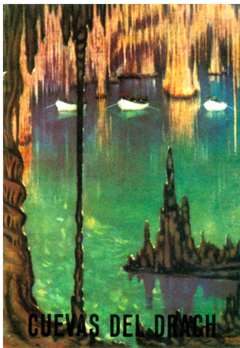
Figura 9: Portada del llibret-guia publicat el 1963 per l'empresa Rieusset, on es mostra una vista del llac Martel amb les barques que transporten els turistes. Figure 9: Cover of the booklet-guide printed in 1963 by the Rieusset publishing house, which shows a view of the Llac Martel with the boats that carry on the tourists.

Juntament amb elles una sèrie d'altres estalagmites van conformant tot un conjunt. Darrera d'elles més columnes en un segon terme, i en el sostre fileres de petites estalactites quasi simulant els dibuixos d'un tapís. Segueix la continua ziga-zaga del camí, ara en un suau pendent de baixada per dur-nos al segon llac en el nostre recorregut, el Canal Blau .