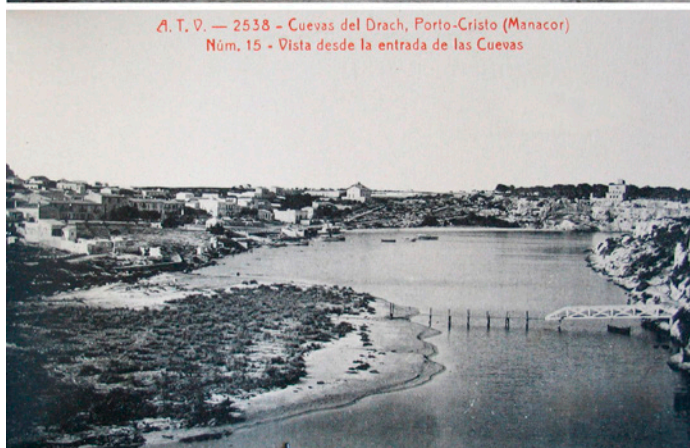
A. T. V. — 2538 - Cuevas del Drach, Porto-Cristo (Manacor) Núm. 15 - Vista desde la entrada de las Cuevas