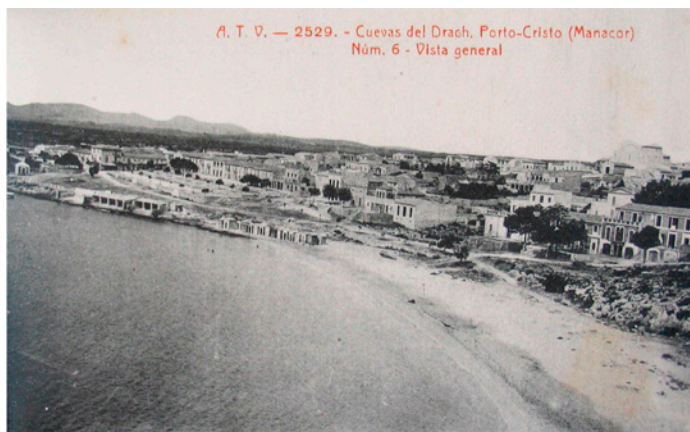
A. T. V. — 2529. - Cuevas del Drach, Porto-Cristo (Manacor) Núm. 6 - Vista general