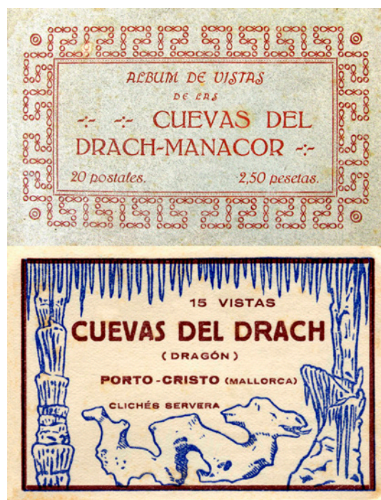
Figura 5: Cobertes d'uns àlbums de postals de l'any 1925 (imatge superior) i de la dècada de 1960 amb fotografies de Zerkowitz (imatge inferior). Figure 5: Covers of an album of postcards with photographs by Zerkowitz, distributed in the 1960s (lower image), and another from the year 1925 (upper image).

Si bé en aquella època les connexions per arribar a Mallorca eren únicament via marítima, a través dels ports de Palma i Sóller (precisament aquest darrer va ser on va arribar en Martel des de França el