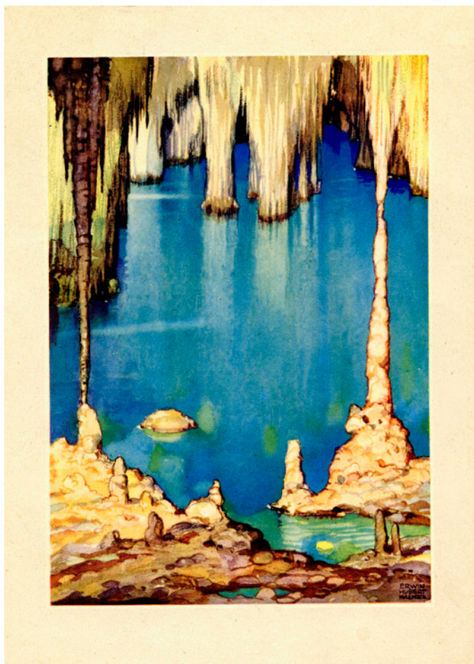
Figura 1: Làmina que reproduïx una aquarel·la de l'artista vienès Erwin Hubert, qui fou un habitual col·laborador del Fomento del Turismo de Mallorca , durant la primera meitat del segle XX. Figure 1: Printed reproduction of a watercolor by the Viennese artist Erwin Hubert, who was a regular collaborator of the society Fomento del Turismo de Mallorca during the first half of the 20th century.

Per al turisme centreeuropeu que en aquells temps optava per apropar-se a la mar hi prevalien les illes gregues, i també les costes del mar Adriàtic. Però el llegat documental i oral de l'Arxiduc i el seus coetanis en les successives cròniques dels viatges a Mallorca i, en general a les Illes Balears, havia anat despertant la curiositat ampliant el ventall de destinacions vocacionals, sobretot en època estival. Així