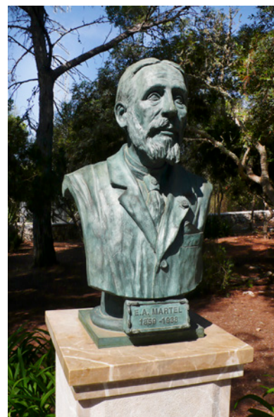
Figura 8: Bust d'Édouard-Alfred Martel situat a prop de l'entrada artificial de la cova.

Avui en dia, en ple segle XXI, Porto Cristo és una localitat que voreja els 10.000 habitants residents i que en la temporada estiuenca pràcticament veu duplicada la seva població. A més, diàriament en les hores centrals del dia el trànsit de vehicles i turistes és una constant al passar pel poble sigui anant o venint de la visita a les coves. Afortunadament, l'increment de les zones reservades per a vianants a primera línia fa molt més atractiva la passejada entre la platja, el port i la zona de les coves del Drac amb el seu extens pinar, els seus ben cuidats jardins que estan molt propers a l'antiga torre de guaita dels Falcons i el far, des d'on es pot gaudir d'una impressionant vista de la badia.