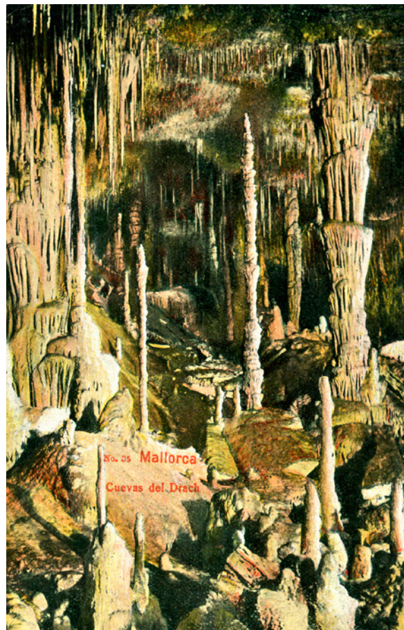
Figura 3: Postal corresponent a una de les primeres sèries colorejades que es varen editar durant la primera meitat del passat segle.

En el camp de la música, amb la creació dels denominats Festivals de la Canción de Mallorca , van sorgir tota una sèrie de grups musicals que van anar enaltint els encants de l'illa (i les belleses que la visitaven!), alguns dels quals van tenir ressonància més enllà de sa Roqueta : Los Javaloyas, Los Valldemossa, Los 5 del Este, etc.