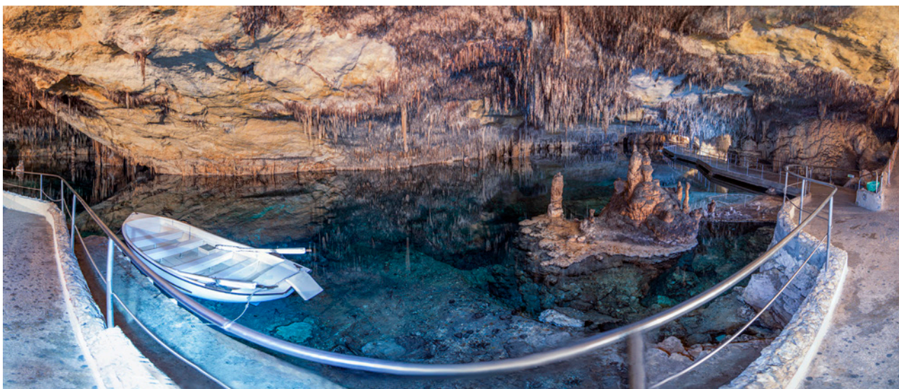
Figura 10: El llac Martel és el més destacable de les Coves del Drac, denominació actual que al·ludeix al seu descobridor. Habitualment és recorregut pels turistes en barques, encara que també pot ser creuat a peu mitjançant una passarel·la lateral. Figure 10: The Llac Martel is the most remarkable lake in Coves del Drac, whose current denomination corresponds to its discoverer. It is usually crossed by the tourists with boats, although it can also be walked on foot by means of a lateral bridge.

I després d'una atenta mirada al seu procés de formació i una reflexió sobre la probable velocitat de creixement, creuem el llindar cap a una altra gran sala, la major i més extensa. La sala on es pot observar el llac Martel . No és fins just abans d'arribar al llac que ens trobem amb una petita mostra d'aigua molt digna de mencionar: la Petita Platja . Tota una joia representativa dels petits llacs que també existeixen a la cova, una clàssica i eterna imatge de postal. Una aparença arenosa sota una illa abraçada per la blanca arena del nostre litoral.