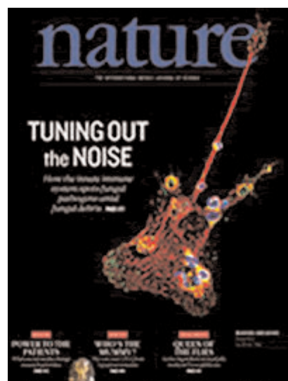
Nature, 28 d'abril de 2011, vol.472 nº7344