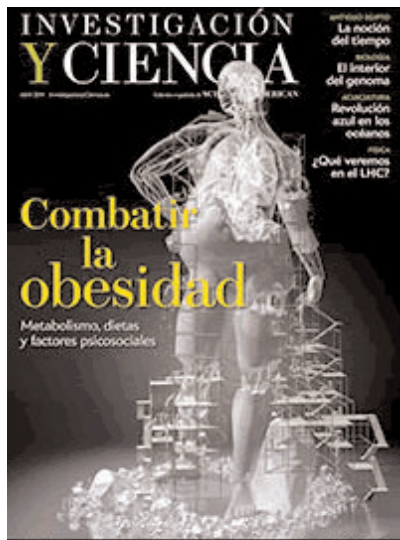
Investigación y ciencia, abril 2011, nº415

9 - Biologia: articles sobre temes íntimament relacionats amb la biologia. En esta revista el