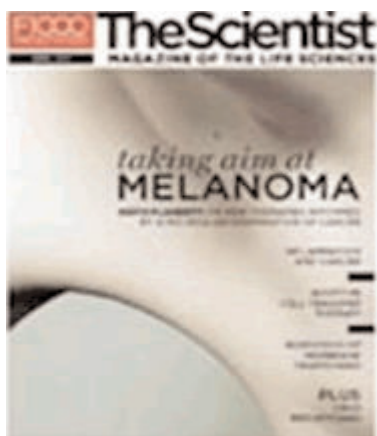
The Scientist, abril 2011 vol.25 n°4

El tema principal d'aquest mes és el " MELANOMA " Taking aim at MELANOMA