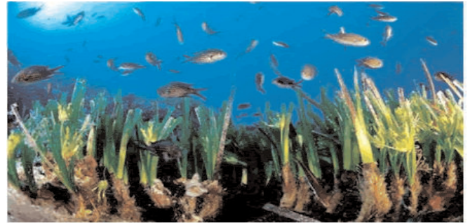
Fotograf: Manu Sanfèlix. http://www.masmallorca.com/plants/posidonia-majorca.html

La posidònia té una gran importància i aporta nombrosos beneficis al seu ecosistema. Es pot dir que aquesta planta és l'arquitecte del món sub marí ja que genera una gran diversitat d'hàbitats (moltes espècies depenen d'ella, ja sigui per alimentar-se, reproduir-se o cercar protecció) i fixa sedi