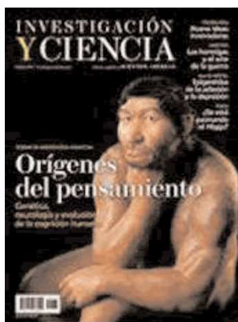
Investigación y Ciencia febrer de 2012. Núm 425

Durant les últimes dècades s'ha intentat obtenir una explicació sobre les característiques físiques i anatòmiques de l'evolució cerebral. Gràcies al descobriment del genoma humà s'ha pogut comparar amb el genoma de ximpanzé i d'altres espècies, confirmant la teoria que el genoma humà ha canviat amb l'evolució. Durant l'evolució s'han produït mutacions en el genoma humà que han afavorit a la cognició de la parla de l'espècie humana. Les mutacions cognitives no només es produeixen a l'àrea neuronal, sinó també en els òrgans com el pulmó, el cor i l'intestí. En els nostres avantpassats que no havien patit aquestes mutacions, es coneix que tenien una millor adaptació al medi en el qual vivien.