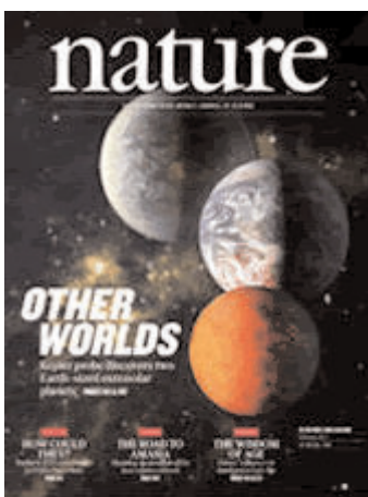
Nature, 9 de febrer de 2012 vol. 482

REVISTA NATURE THE DROSOPHILA MELANOGASTER GENETIC REFERENCE PANEL (DGRP)