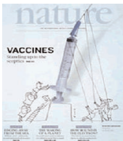
Nature, 26 de maig de 2011, vol. 473, núm. 7348

A la revista Nature, els continguts estan dividits en 5 apartats; en el primer apartat es tracten els temes més rellevants de la setmana, en el que s'inclou l'editorial o les darreres investigacions. El segon apartat comenta les notícies més importants com que la poleo ha augmentat