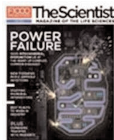
The Scientist , May 1, 2011 Volume 25 Issue 5

El que fa falta, doncs, és trobar un equilibri entre competència i cooperació, tal i com ha fet la comunitat microbiana per tal de sobreviure. Pot ser que els científics, mentre duen a terme els seus estudis sobre les comunitats microbianes aprenguin a treballar junts eficaçment, obtenir idees de com poden fer feina millor com una comunitat de científics, com són.