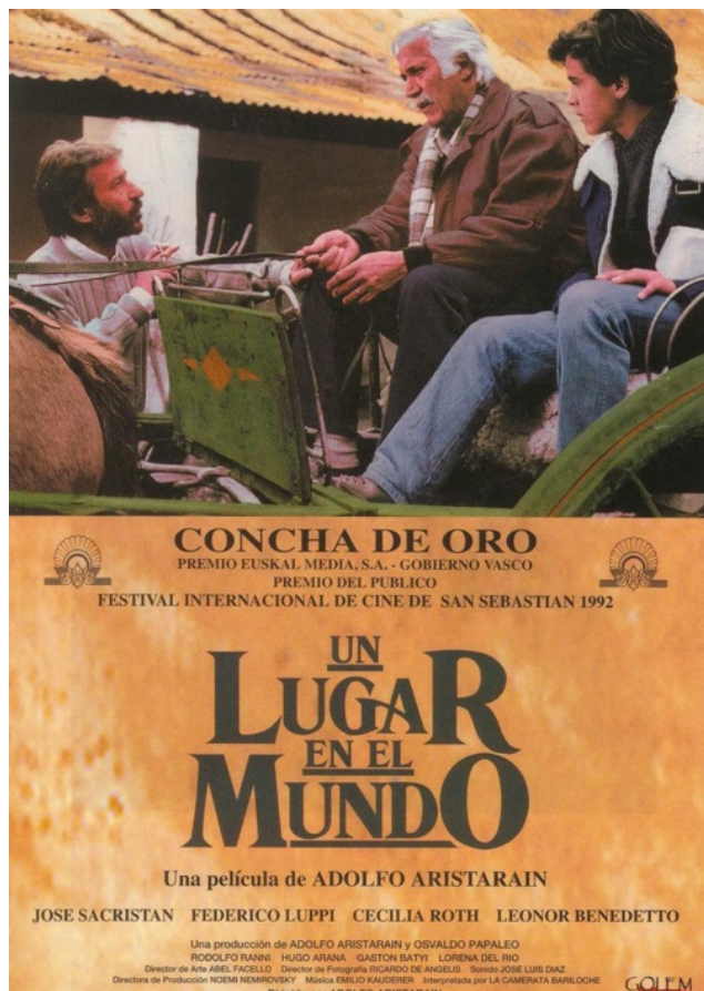
Fig. 1. Cartell de la pel·lícula Un lugar en el mundo , A. Aristarain, 1992.