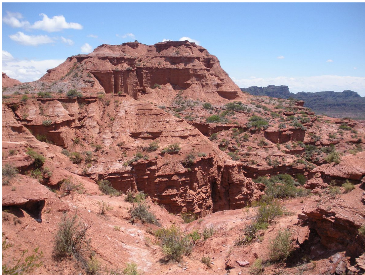
Fig. 4. El paisatge al Parque Nacional de la Sierra de las Quijadas (Argentina).

mundo també presenta reminiscències de Western, per la inexistència de l'Estat, l'exaltació de l'èpica i la presència del “foraster” (Hans) (CASELLA, 1993: 109-122). Al seu estudi sobre la cinematografia d'Aristarain, Fernando Brenner apunta la influència d' Arrels profundes ( Shane , George Stevens, 1953) (BRENNER, 1993: 49).