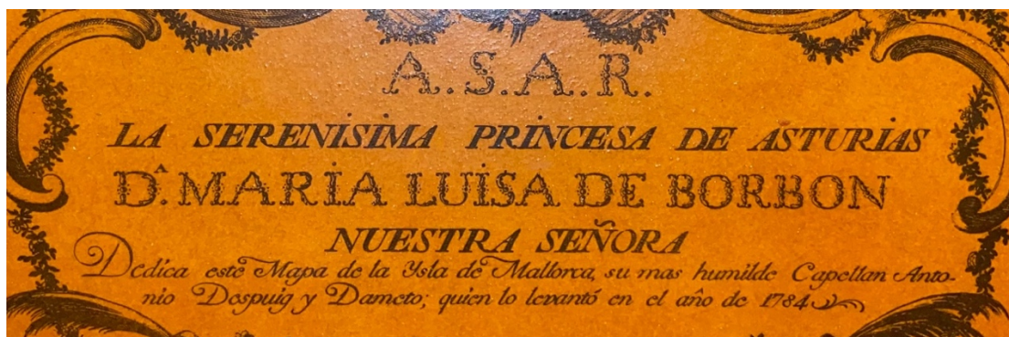
Fig. 1. Mapa del canonge Despuig. L'única al·lusió a l'autoria és la dedicatòria del mapa a la princesa Maria Luisa de Borbón (1784).