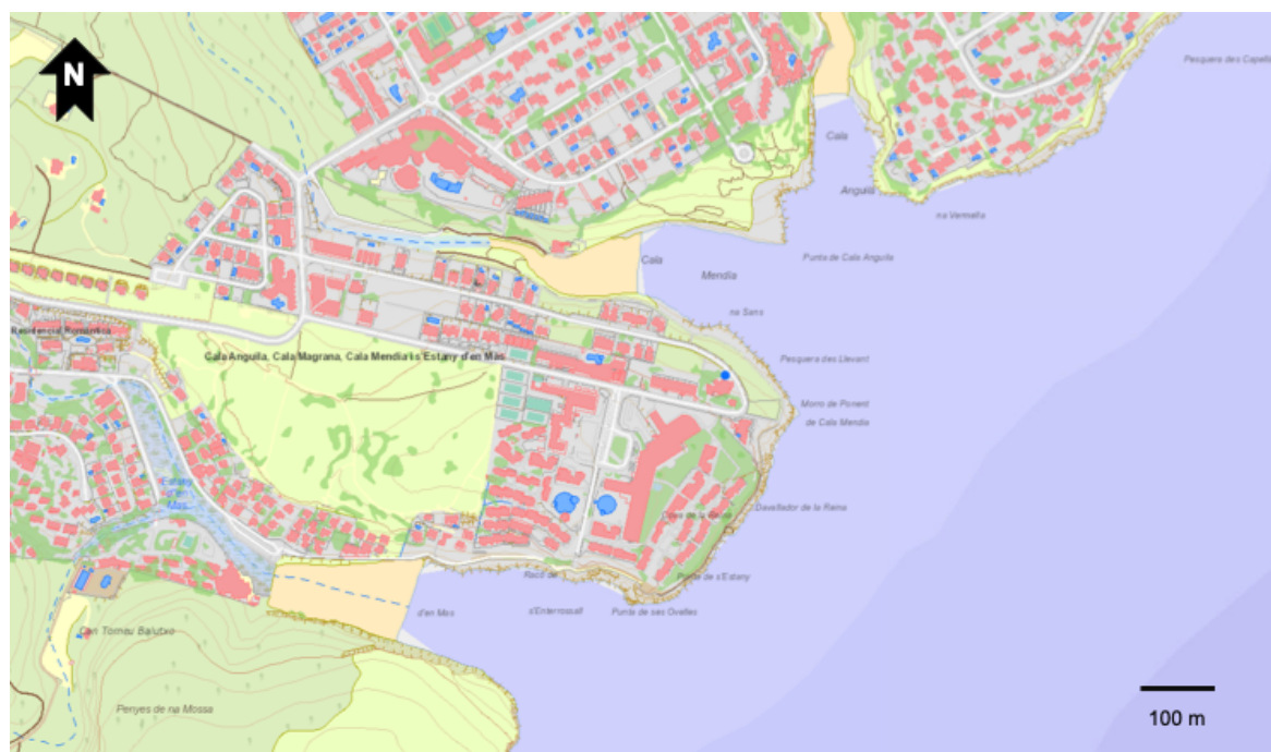
Fig. 2. Mapa oficial actual. Sota l'apel·latiu "turístic" de Cala Romántica s'agrupen cala Anguila, cala Mendia i s'estany d'en Mas.

El món mariner sovinteja al litoral i sobretot a les cales que empra com a refugi i base. Arriba a la culassa de la cala de Sant Nicolau o Portopí on hi havia una capelleta (BINIMELIS, 1595) o al caló de Port Alt , documentat el 1405 i 1595 per l'autor anterior com a cala Portals Vells on hi havia una de les pedreres de la Seu de Mallorca; ara és el caló de Portals Vells. El caló des Còmit apareix als mapes de 1785 quan encara sabien el càrrec que exercia: un oficial de la galera; ara ja no es diu i s'anomena caló de Son Caios o cala Estància (P) a l'enfront de l'illot de sa Galera (al barri de l'horrible nom de Can Pastilla). 6