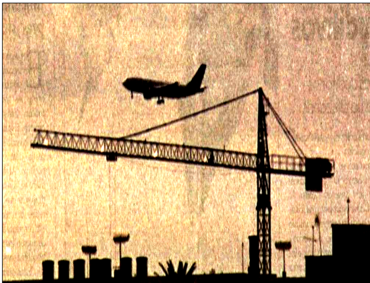
Fig. 2. Els negoci turístic i immobiliari, les dues fórmules d'acumulació de capital a Mallorca des de la segona meitat del segle XX.