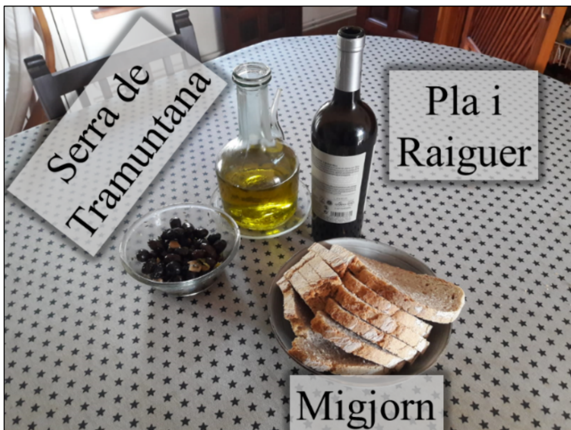
Fig. 1. La trilogia mediterrània representada sobre les taules tradicionals i el seu desplegament espacial.

La trilogia mediterrània, per tant, cal convenir que deu el seu èxit a les possibilitats que ofereix per al comerç, més que per les seves qualitats nutricionals. Des de la seva consolidació, aquesta trilogia és completament inserida dins la cultura culinària mediterrània i, de forma directa o indirecta, ha seguit representada sobre les taules tradicionals mallorquines quan, amb independència dels plats que es servien, presidien la taula les olives i el setrill d'oli (serra de Tramuntana), el vi (Pla i Raiguer) i el cereal en forma de pa (Migjorn) (Fig. 1).