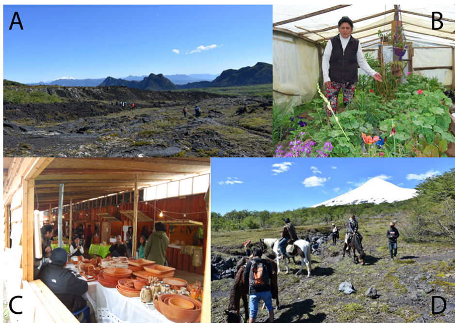
Fig 3. Ejemplos de actividades turísticas de las comunidades presentes en la zona de estudio. A: Rutas ancestrales cordilleranas. B: Visita guiada a un huerto ecológico reservorio de semillas antiguas en Pucura. C: Feria de artesanías organizada por la Asociación de Pequeños Agricultores y Artesanos en Pucura. D: Rutas a caballo hacia el Rukapillán guiada por integrantes de las comunidades.

Fig 3. Examples of tourist activities of the communities of the study zone. A: Ancestral mountain routes. B: Guided visit to an ecological garden with ancient seeds in Pucura. C: Handicraft fair organized by the Association of Small Farmers and Artisans in Pucura. D: Horseback riding routes to Rukapillán guided by members of the communities.