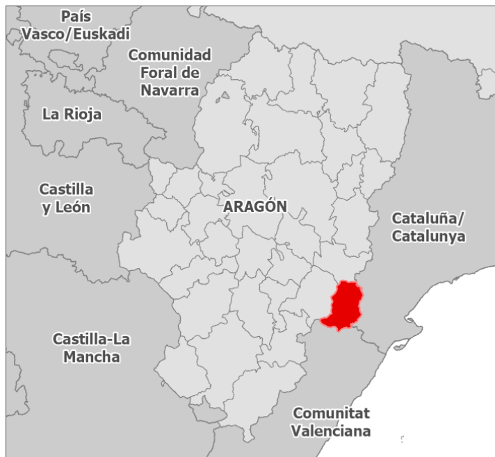
Fig. 1. Mapa de localización de la comarca del Matarraña.

La Comarca del Matarraña se localiza en la provincia de Teruel (Fig. 1). Cuenta con 18 municipios que congregan 8.200 habitantes con una densidad en torno a 9 habitantes/km 2 , una de las más bajas de España. Es una población envejecida con un peso del sector primario está próximo al 30%, el industrial al 18%, la construcción al 9% y el sector servicios con fuerte peso del turismo se sitúa por encima del 40%. La oferta del número de plazas turísticas es superior a 2.000, lo que supone una proporción de una plaza por cada cuatro habitantes.(IAEST, 2019).