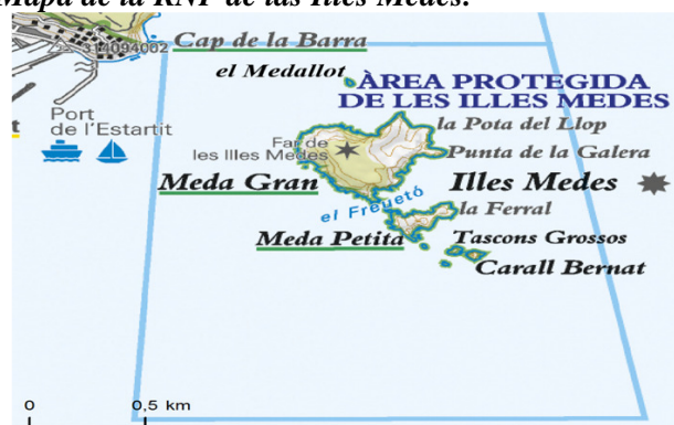
Figura 2: Mapa de la RNP de las Illes Medes.