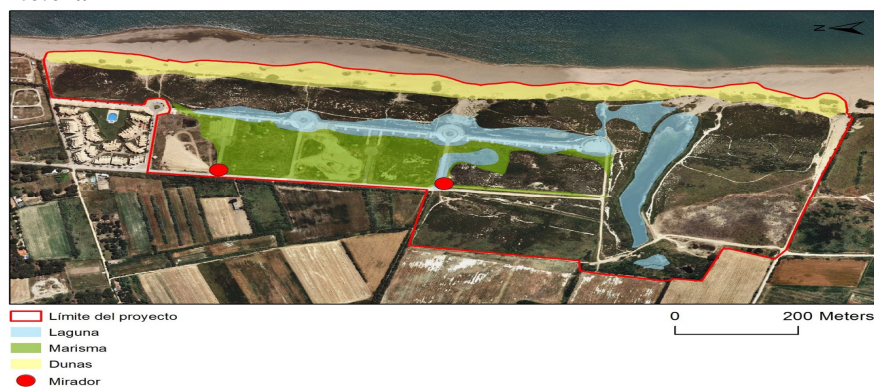
Figura 3: Esquema de área de intervención del proyecto Life. RNP de la Pletera