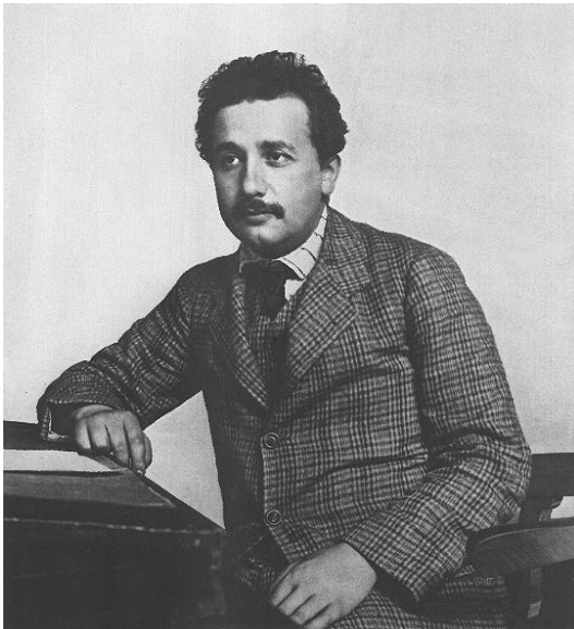
Figura 2. Albert Einstein quan treballava a l'oficina de patents de Berna, època en què va crear la teoria especial de relativitat.

arrelats tot i que la relativitat va demostrar que són erronis analitzant els fets provats per l'experiència sense prejudicis. La teoria de Newton era plenament compatible i reforçava el principi de relativitat clàssic segons el qual les lleis de la mecànica no ens permeten discernir quin és el nostre moviment si aquest no és accelerat. En aquest marc teòric, Newton va crear la Llei de Gravitació Universal que explicava tot l'Univers observat i feia prediccions sobre el no observat. Va permetre a Le Verrier, cap el 1840, preveure l'existència del planeta Neptú a partir d'unes anomalies en l'òrbita d'Urà, tot un èxit que feia pensar que era la teoria definitiva. Tant sols unes petites pertorbacions de l'òrbita de Mercuri, un excés en la precessió del periheli de 43'' d'arc per segle, no trobaven explicació amb la teoria de Newton, el mateix Le Verrier es va aventurar amb la hipòtesi de l'existència d'un planeta més intern, Vulcà, que resultà inexistent.