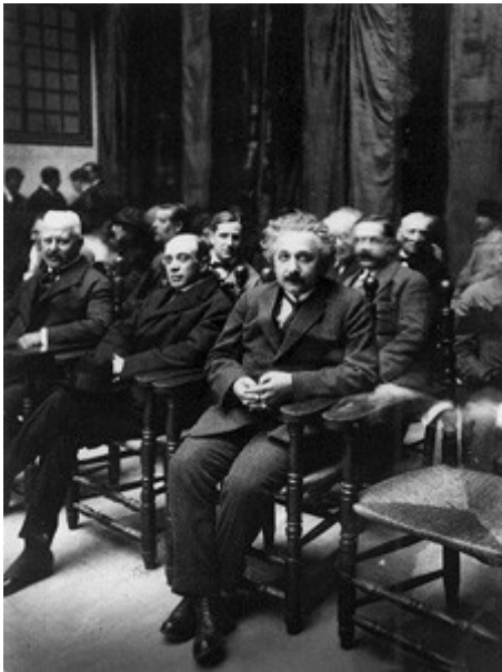
Figura 4. Albert Einstein durant la seva visita a Barcelona, l'any 1923.

Amb tot això es canviaven els fonaments de la Llei de Gravitació Universal de Newton, la seva obra mestre, i ara s'havia de crear una nova teoria de gravitació compatible amb la relativitat recentment nascuda, segons Einstein el que s'havia fet era un joc de nins comparat amb aquesta nova tasca, de fet s'hi va dedicar els deu anys següents fins que al desembre del 1915 va acabar de formular la teoria general de la relativitat que és la teoria de gravitació actual, en aquesta ja no hi ha una força entre les masses, aquestes es mouen per un espai-temps corbat degut a la presència de les masses. Aquesta nova teoria com havia fet la de Newton explicava totes les observacions, també l'excés en la precessió del periheli de Mercuri de 43'' d'arc per segle, i feia prediccions que encara ara no hem de comprovar en la seva totalitat. Una de les prediccions era la desviació de la llum al passar prop del Sol que es va poder comprovar durant l'eclipsi de Sol del 29 de maig de 1919; quan es feren públics els resultats tota la societat se'n va fer ressò i Albert Einstein es va fer mundialment famós (Fig. 4). Per entendre aquest fet hem de tenir present la importància del llegat de Newton que s'acabava de refutar.