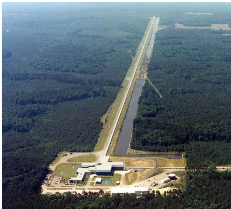
Figura 5. Vista aèria de les instal·lacions a Livingston (Louisiana) que alberguen l'interferòmetre per a la detecció d'ones gravitatòries, cada un dels braços és de 4 km de longitud.

Una de les prediccions de la teoria general de relativitat és que les perturbacions de l'espai-temps generades per les masses es propaguen en forma d'ones, predicció similar a la feta per Maxwell de les ones electromagnètiques. De les ones gravitatòries tan sols en teníem evidències indirectes fins que el 14 de setembre del 2015 es varen detectar directament, cent anys després que Einstein en fes la predicció. Perquè ens fem una idea del que significa detectar aquestes ones directament, les deformacions que produeix el seu pas són variacions de longitud de la grandària d'un àtom d'hidrogen comparada amb l'òrbita de Saturn, tot un èxit per a la tecnologia actual. Els primers observatoris són interferòmetres de braços quilomètrics, n'hi ha dos a Europa i tres a Estats Units, que amb la detecció d'ones gravitatòries ens obrin una nova finestra a l'Univers (Fig. 5).