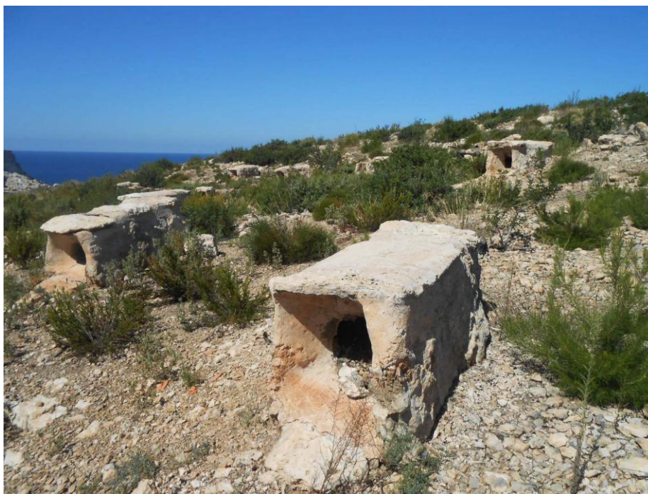
Fig. 1.: Antigues caseres de cala Xarraca (Eivissa).

Les diferències genètiques produïdes per l'aïllament geogràfic de les Illes i l'enclavament exclusiu ha creat fins i tot dues poblacions amb llinatges distintes: un tipus comú a Eivissa i Formentera, i l'altre present a Menorca i Mallorca. Les diferències genètiques es troben encara en fase d'estudi, i es considera que és difícil entendre cap on es modifica la raça balear i quines són les qualitats i avantatges resultants, malgrat ja experimenten diferències en el fenotipus. El resultat és que les diferències genètiques han aportat unes distincions en el seu aspecte; les abelles de les Illes són més petites, més fosques i tenen menys pèls que les peninsulars (fig. 2).