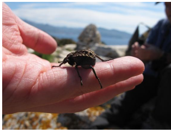
Fig. 2: Escarabat bonyarrut ( Brachycerus barbarus ). La seva presència a sa Dragonera havia esdevingut molt rara, i sembla haver augmentat als darrers anys. Cala Lladó, juny 2013.