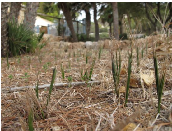
Fig.1: Plançons de Chamaerops humilis , germinats de forma natural baix els exemplars adults del jardí de cala Lladó. setembre 2014.