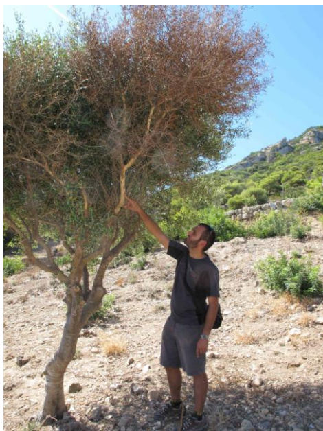
Fig. 3: Exemplar adult d' Olea europaea var. silvestris amb les branques superiors rosegades per les rates. Any 2010, es Tancat.